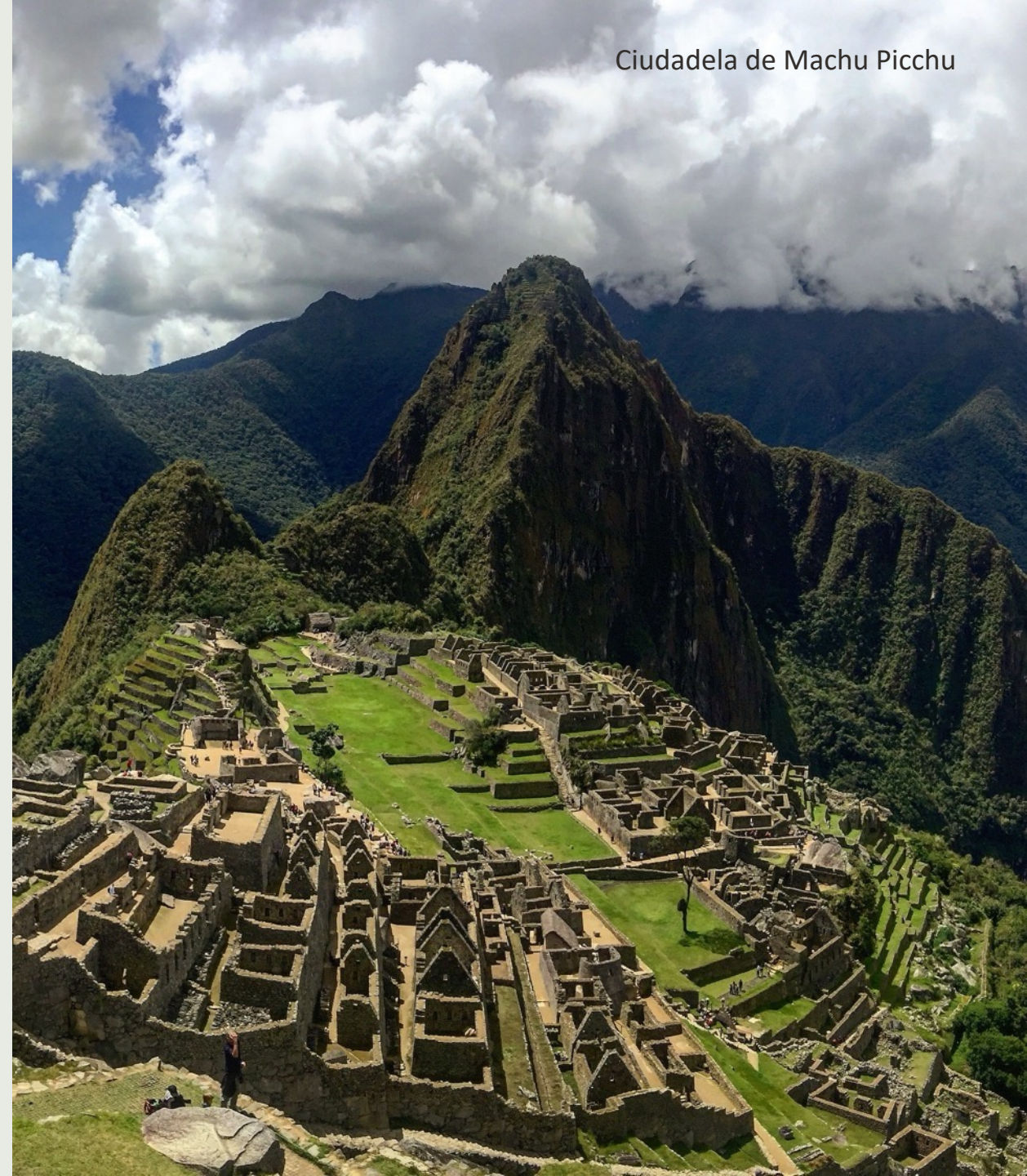
Ciudadela de Machu Picchu